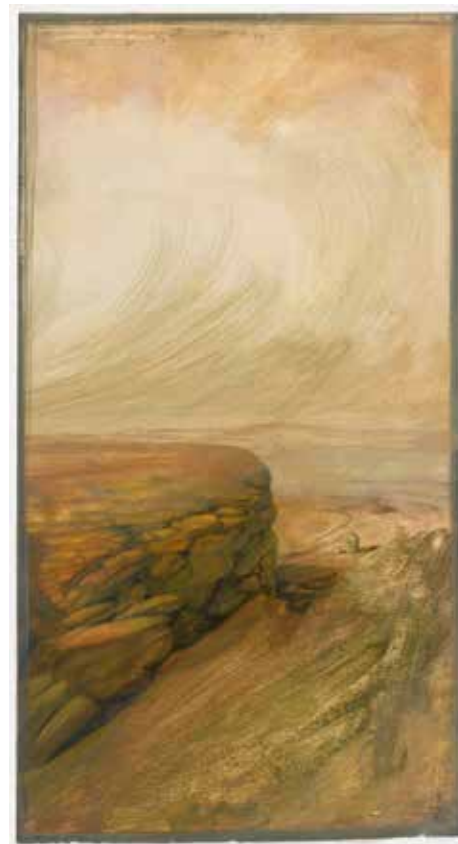
Tinus Vermeersch, Zonder titel , 2012, tempera op geprepareerd papier, 59 x 27 cm PRIVÉCOLLECTIE

DE EENZAAMHEID VAN HET ATELIER De tekeningen en beeldhouwwerken van Tinus Vermeersch zijn zowel intrigerend als enigmatisch. Er komen tal van figuren in voor. Wat op het eerste gezicht een hooiopper lijkt, heeft toch enige gelijkenissen met een barokke pruik. Die vorm vinden we verder terug als lichaam van personages, van een fabelfiguur met een vogelkop met extreem lange bek. Van die 'hooiopper' bestaat een sculptuur. Ook de vogelkop vinden we terug in sculpturale vorm. Het zijn objecten die de zinnen prikkelen, die je dwingen om mee te gaan en te fantaseren, om een eigen verhaal te vertellen.