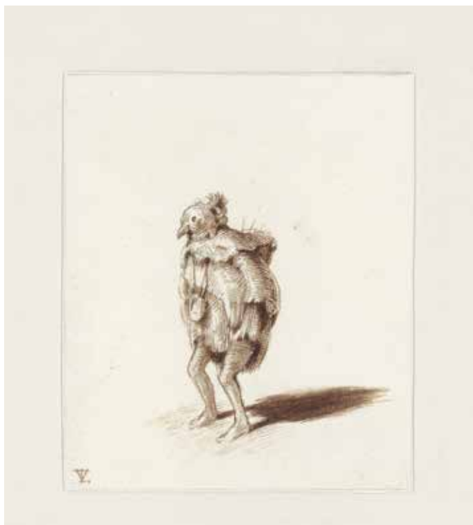
Tinus Vermeersch, Zonder titel , 2009, inkt op papier, 11,2 x 8 cm PRIVÉCOLLECTIE

Voor zijn eindwerk maakte Tinus Vermeersch een reeks geboetseerde portretten en een zelfportret. Na zijn afstuderen was hij voornamelijk bezig met tekenen en schilderen, met af en toe wat beeldhouwwerk.